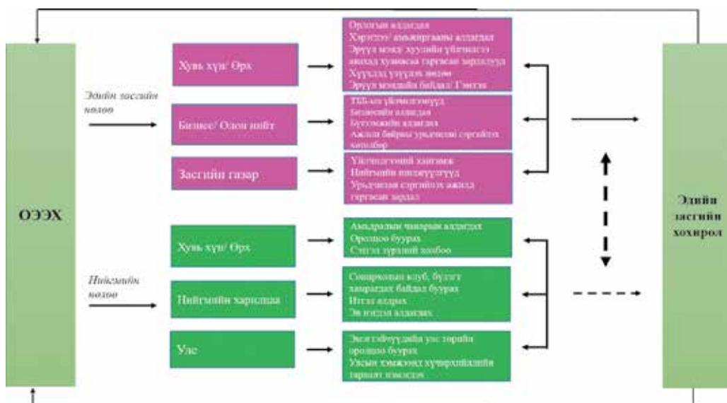
Зураг 2: ОЭЭХ-ээс үүдэлтэй нийгэм, эдийн засгийн нөлөөг илтгэсэн судалгааны бүтэц

ОЭЭХ нь эмэгтэйчүүд, тэдний гэр бүлд төдийгүй олон нийт, бизнесийн байгууллага, нийгэмд ихээхэн хохирол учруулж, олон талын сөрөг нөлөөтэй болохыг бүгд хүлээн зөвшөөрдөг болсон. Доорх зурагт үзүүлсэн Судалгааны бүтэцэд ОЭЭХ-ээс үүдэлтэй эдийн засаг, нийгмийн хохирлын өртөгийг хувь хүн/айл өрх, олон нийт/бизнесийн байгууллага болон засгийн газар/улс орны түвшин тус бүрт тоймлон харуулав 1 . Мөн эдгээр түвшин тус бүрт учирч буй эдийн засаг, нийгмийн хохирлын өртөгүүд нь бүхэлдээ эдийн засгийн алдагдалд хүргэж байгааг харуулав. Хувь хүний болон өрхийн орлогын алдагдал зэрэг эдийн засгийн алдагдалууд нь эдийн засгийн өсөлтөд сөргөөр нөлөөлж байна.