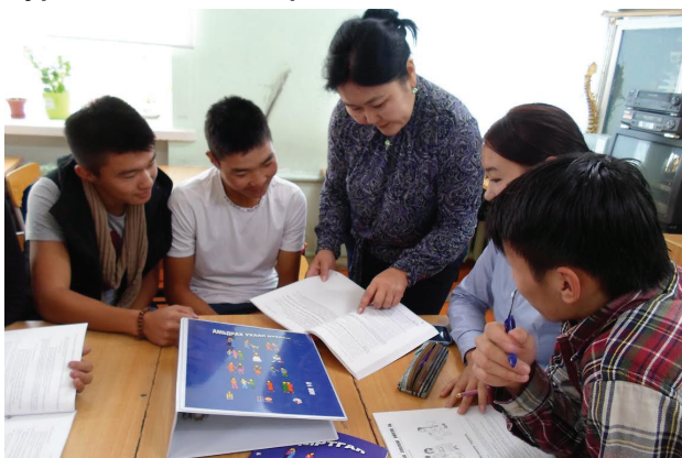
НҮБХАС өсвөр үе, залуучуудад зориулсан амьдрах ухааны боловсролыг дэмждэг.

НҮБХАС, Боловсрол, шинжлэх ухааны яам, Хөдөлмөрийн яамтай хамтран мэргэжлийн сургалт үйлдвэрлэлийн төв /МСҮТ/, их