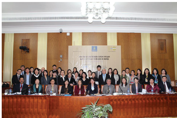
Улаанбаатарын тунхаглалыг батлав.

НҮБХАС-ын нөлөөллийн үйл ажиллагааны үр дүнд 2013 оны 9 сарын 30-ны өдөр Үндэсний дээд хэмжээний уулзалтаар Монгол улсын хүн ам ба хөгжлийн асуудлаарх Улаанбаатарын тунхаглалыг батлав. Улсын Их Хурлын гишүүд, бодлого боловсруулагчид, засгийн газрын албаны хүмүүс, иргэний нийгмийн байгууллагын тэргүүнүүд болон олон улсын байгууллагуудын төлөөлөлүүд оролцсон уг уулзалтаар хүн ам ба хөгжлийн асуудлаарх үндэсний ахиц дэвшлүүдийг хэлэлцэж, Ази, номхон далайн хүн амын бага хурлын зөвлөмжүүдийг хэрэгжүүлэх алхамуудыг тодорхойлов. Улаанбаатар тунхаглалаар Монгол Улсын Засгийн Газар хүн ам ба хөгжлийн асуудлыг шийдвэрлэх урт хугацааны бодлого, стратегиудыг боловсруулах, тэдгээрийг үндэсний нийгэм эдийн засгийн хөгжлийн бодлогуудтай уялдуулахаа амлав. Түүнчлэн уг тунхаглалаар үндэсний болон олон улсын хамтрагч талууд хүн ам ба тогтвортой хөгжлийн уядааг хангаж, бүх нийт түүний дотор өсвөр үе, залуучуудад зориулсан нөхөн үржихүйн эрүүл мэндийн үйлчилгээний чанарыг сайжруулж, хүртээмжийг нэмэгдүүлэх, жендэрт суурилсан хүчирхийлэл, ялгаварлан гадуурхалтыг устгахад хүчин чармайлтаа нэмэгдүүлэхээ амлав. Монгол Улсын Засгийн Газар одоо хүн амын талаар баримтлах үндэсний цогц бодлогоо (2014-2020) боловсруулж, хэрэгжүүлэхээр ажиллаж байна.